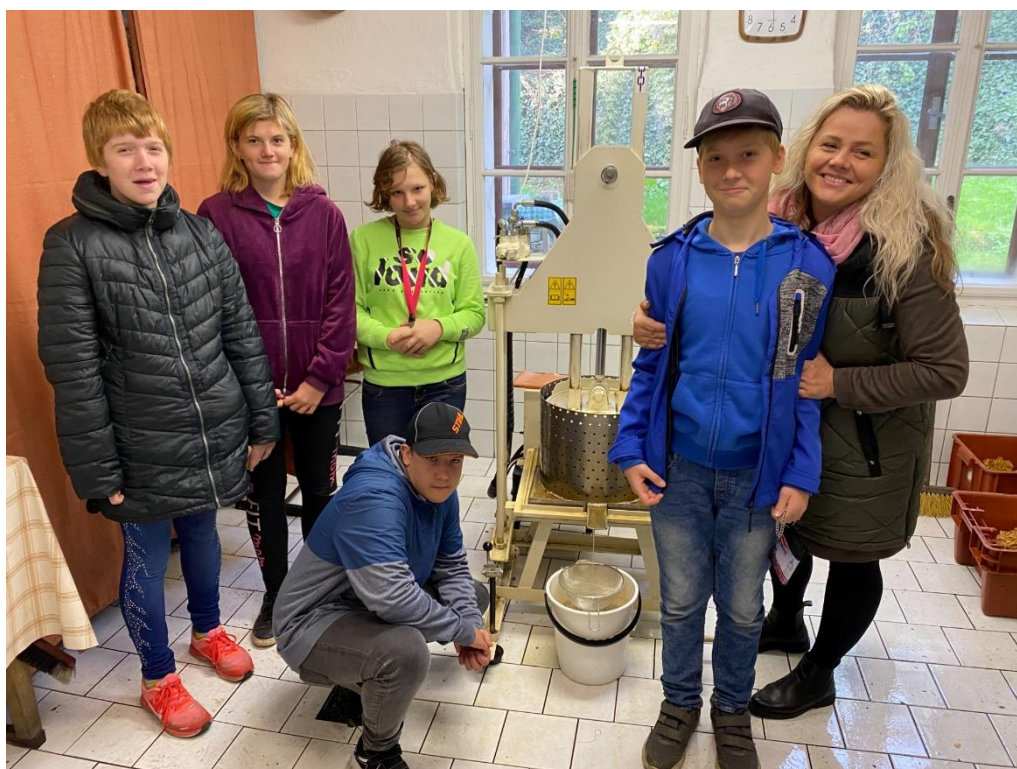
Moštování, Zahrádkářský svaz Heřmanův Městec