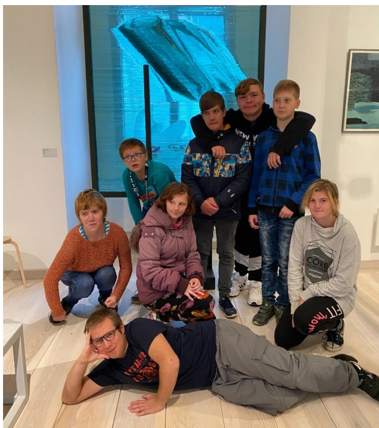
knižní a herní veletrh "Zámek plný knih"