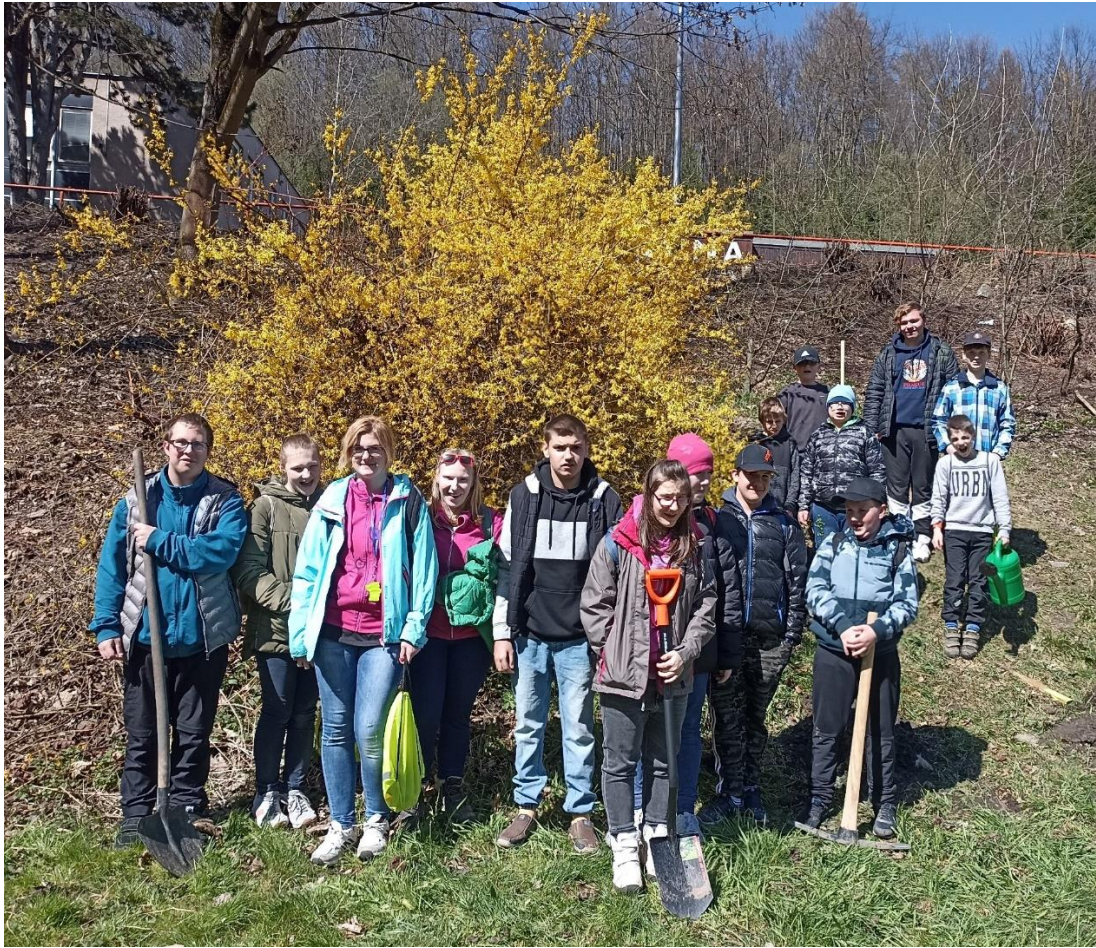
Den Země, CEMEX Prachovice