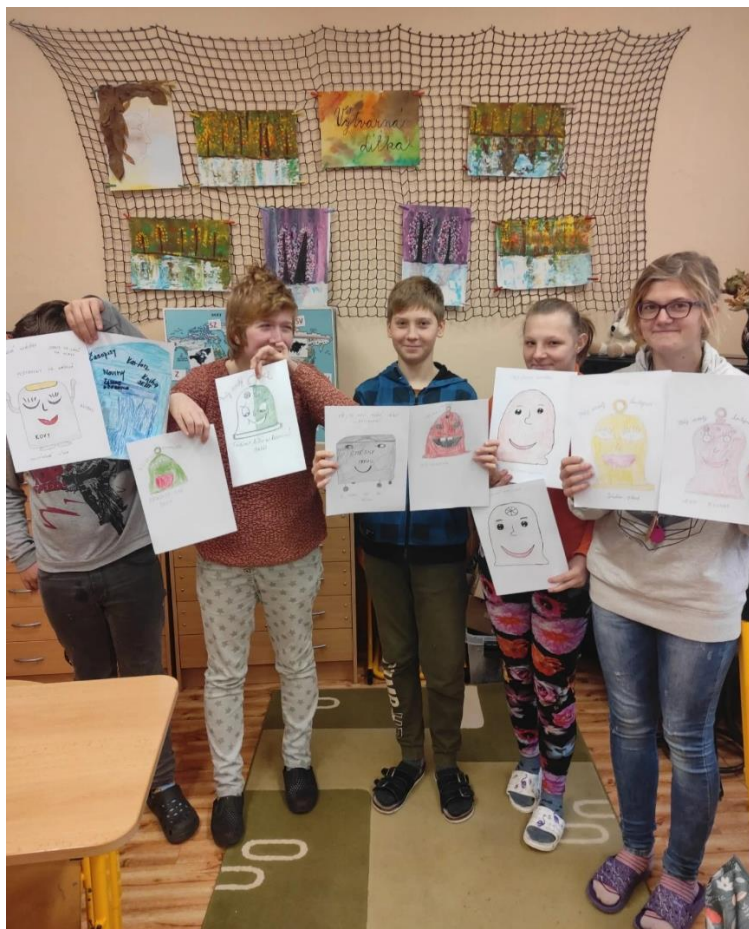
Třídíme odpad, projektový den