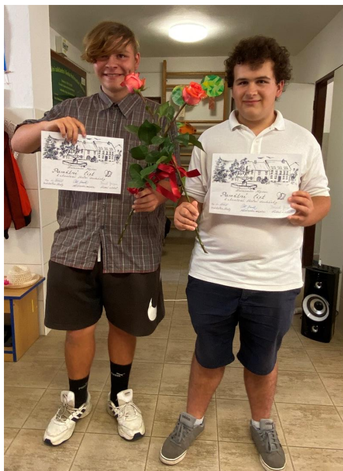
Slavnostní vyřazení žáků 9. ročníku