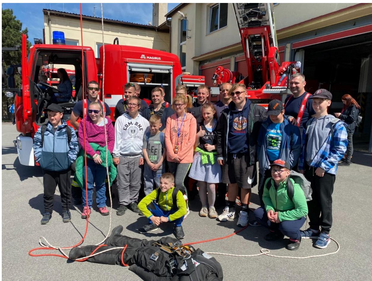
Den otevřených dveří, centrální hasičská stanice Chrudim