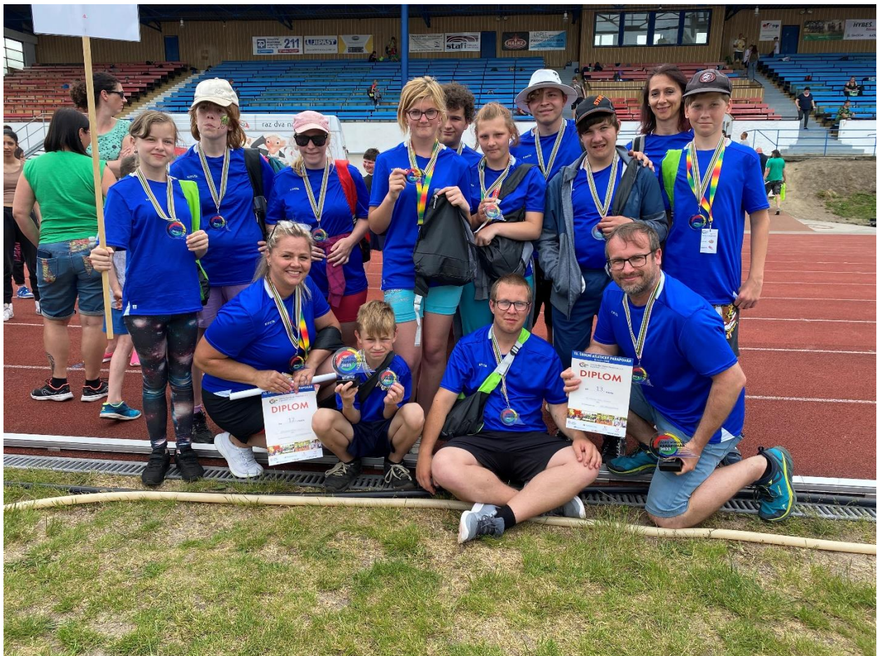
Parapohár, Atletika Bez Bariér, Pardubice