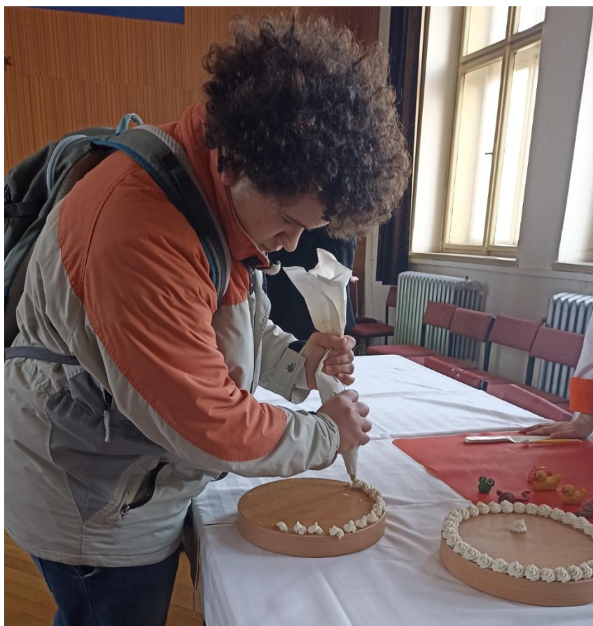
Exkurze SOU Čáslav