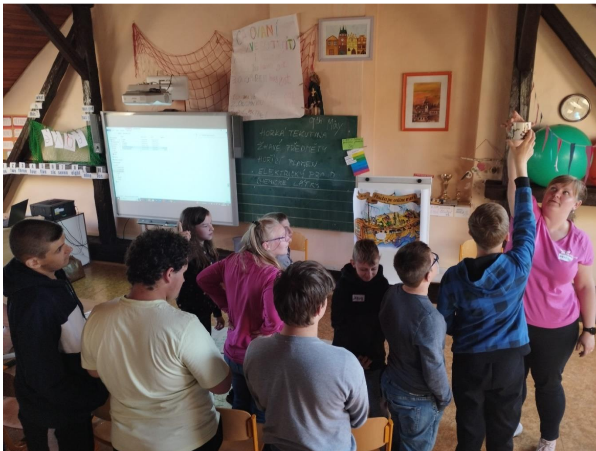
„Už vím, že pálí“, preventivní program