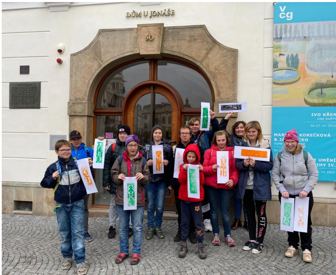
Tisknu, tiskneš, tiskneme, Dům u Jonáše Pardubice