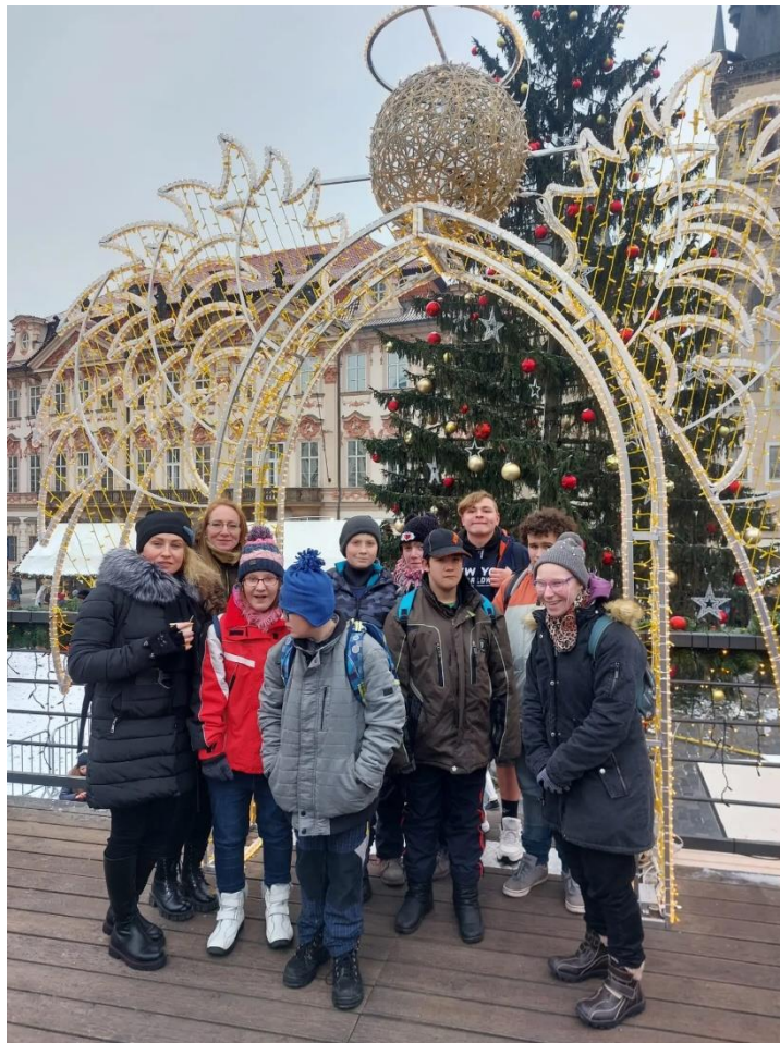
Vánoční výlet do Prahy