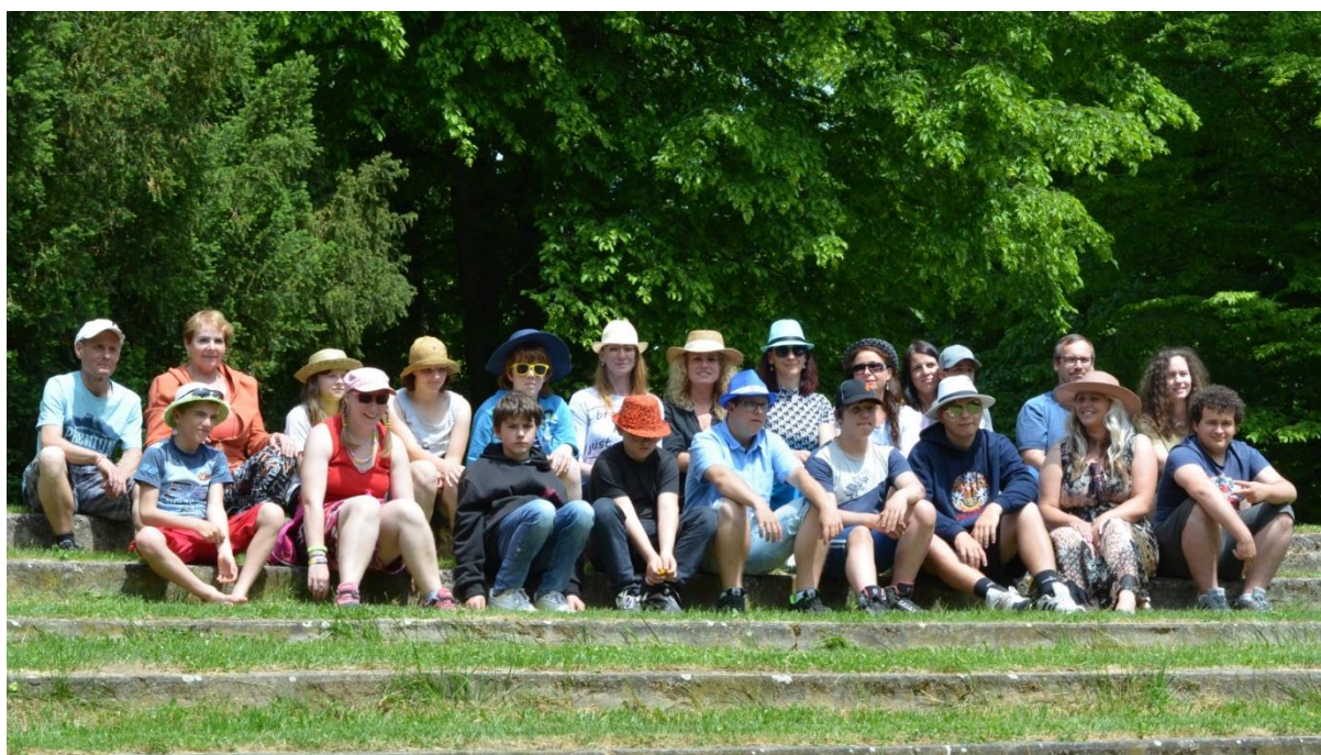
Mezinárodní den dětí, Den pro rodinu