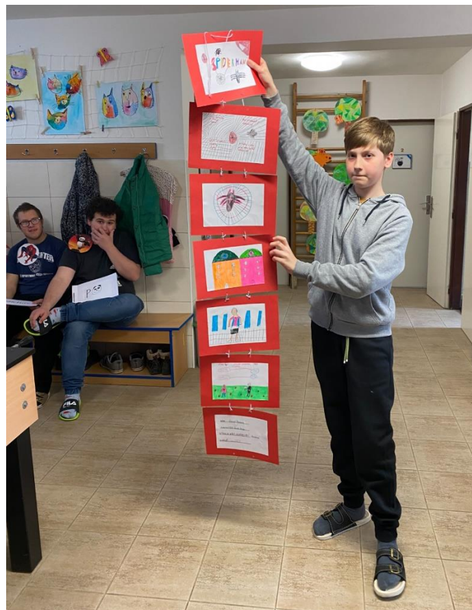
Den s hrdinou, projektový den