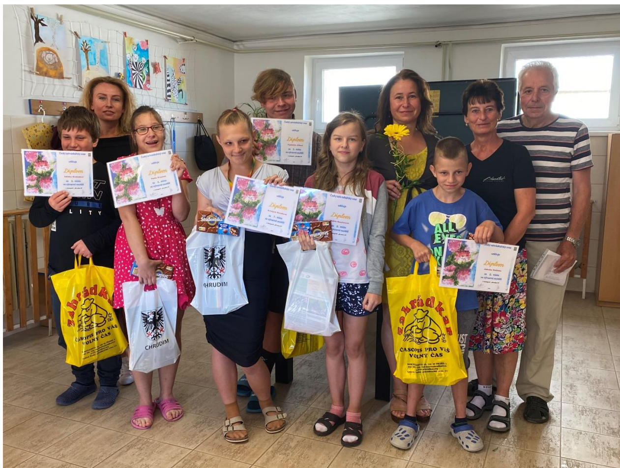
Výtvarná soutěž „Krása a zdraví ze zahrady“