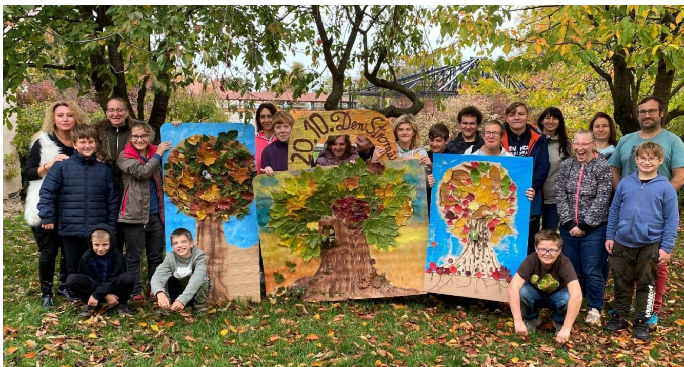
Den stromů, projektový den